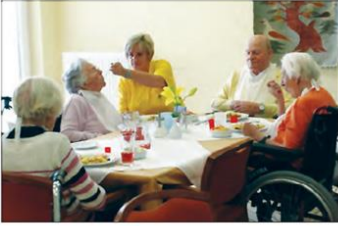
Almanya'da yaşlı nüfus oranı yüksek olup yaşlı nüfusun önemli bir kısmı bakımevlerinde kalmaktadır.

Başta Almanya, Fransa ve İngiltere olmak üzere gelişmiş Avrupa ülkelerinin tümünde doğum oranları düşük, yaşlı nüfus oranı ise yüksektir. Hatta Almanya'da nüfus artış hızı 2000'li yıllarla birlikte eksi değerlere bile düşmüştür.