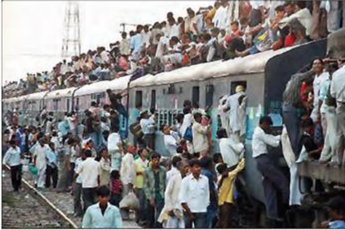
Hindistan'da nüfus fazla, nüfus yoğunluğu yüksektir.

Doğum oranlarının ve doğal nüfus artışının çok yüksek olduğu ülkeler, nüfus artış hızını azaltmaya çalışmaktadır. Bu ülkeler, genellikle kalkınma hızının nüfus artış hızından düşük olduğu az gelişmiş ülkelerdir.